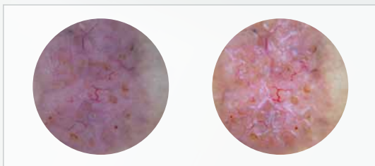
Aufnahme mit nicht-polarisiertem Licht

„Blink Sign“ bei der Aufnahme eines Basalzellkarzinoms